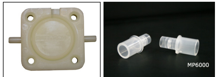
전기화학식 센서(Fuel Cell Sensor) 전용 마우스피스 MP6000