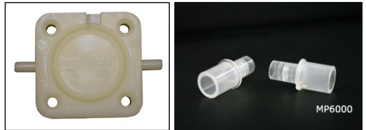
전기화학식 센서(Fuel Cell Sensor)